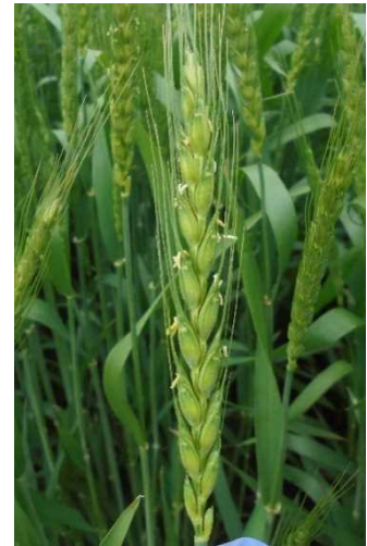
図1 小麦「さとのそら」の開花期の様子

1) 赤かび病の子のう孢子の飛散好適条件となった日数であり、①日最低気温10度以上、②日最高気温15℃以上、③降雨日とその翌日、これら3つの条件が揃った気象状況の日数を示す。古河アメダスによる。2) 茨城県病害虫防除所発行の病害虫発生予察情報から数値を引用。3) 1998年（平成10年）産では赤かび病が多発し、被害金額は全国で約22億円と見積もられている。4) 網掛け部分は図2に赤かび病の子のう孢子飛散好適日の推移を示す。