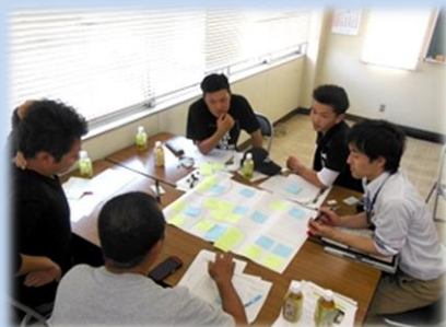
5月 開講式(グループワーク)