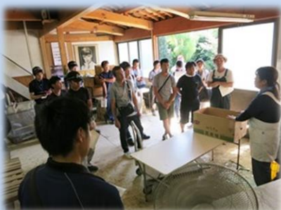
7月 ネギ先進農家研修