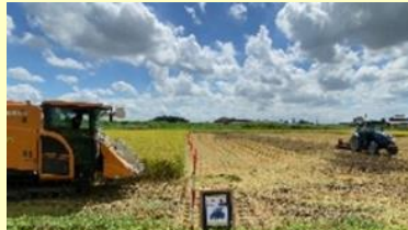
②収穫同時すき込み