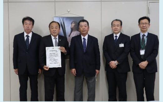
写真。認定証交付式の様子