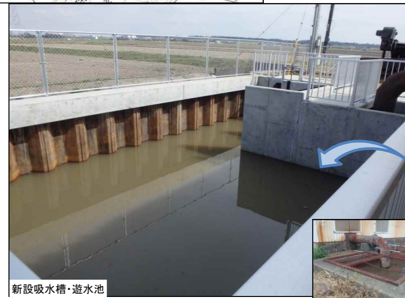
新設吸水槽・遊水池