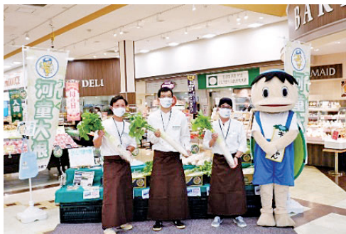
販促イベントの様子

令和4年2月1日、部員数10名でJA水郷つくば大根生産部会青年部が発足しました。大根生産部会（部会員数34名）は牛久市を中心にブランド農産物である「うしく河童大根」を生産しており、青年部は新規就農者を含めた20～40代の若手生産者で構成されています。