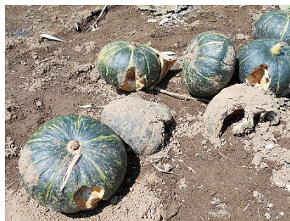
イノシシに食害されたカボチャ