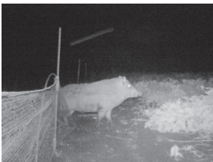
防獣ネットを押し倒して侵入するイノシシ

イノシシ対策としては、電気柵やワイヤーメッシュ柵等を圃場周囲に設置し、侵入させないことが重要です。また、被害が確認されていない圃場でも、イノシシのエサとなる廃果を放置しないことや、イノシシの住処となる耕作放棄地を草刈りする等、地域が一丸となって対策することが大切になります。