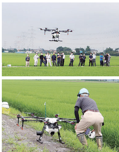
水稲でのドローン防除 現地検討会の様子

近年のICTの発展により、農業用ドローン（以下ドローン）の普及が拡大しており、農作業への活用も活発になっています。特に水稲では多くの殺虫剤が「無人航空機による散布」で登録され、殺菌剤についても登録が増えています。また、最大積載量が大きな新機種が発売されるなど、今後も用途・利便性の向上が見込まれています。