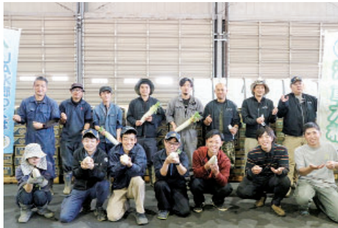
大根生産部会青年部集合写真