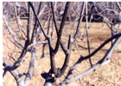
図2 予備枝より発生した充実した結果母枝