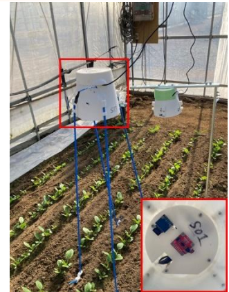
図 機器による生育量の測定