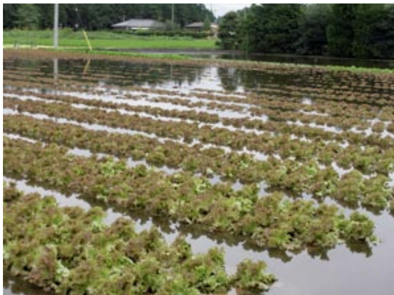
図1 大雨によるレタス圃場の湛水被害状況

降雨被害が多発した圃場の状況を表4に示した。最も大きな被害要因は、圃場が湛水した日数であった。“甚”と“多”では圃場が平均8.8日間湛水していたのに対し、“中”の圃場では4.8日、“少”の圃場では