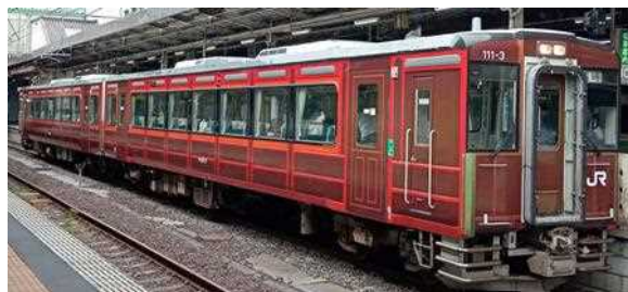
「懐かしの水郡110系号」で使用するキハ110系「レトロラッピング車両」 ※写真はイメージです。

レトロ調にラッピングされた110系気動車がこの夏、初めて水郡線で運転します！リクライニング仕様の座席で快適に過ごしながら車窓から自然あふれる沿線の景色をお楽しみください。