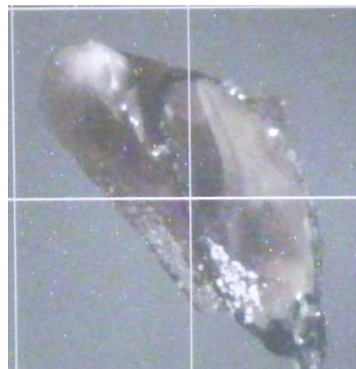
図 3 測定試料

500kW、測定波長領域：2.3～6.3 Å、測定時間：30min。図 3 にマウントした単結晶試料写真を示す（写真縦横長さ：3mm）。が結晶試料が 2.69mm 3 ～16.3mm 3 程度の大きさであり、ほぼ全ての結晶で明瞭な回折斑点を確認することができた（目視分解能：最高 2.6 Å）。その中から、特に結晶性の良いものを選び出し、長時間測定を実施した。測定条件は以下のとおりである。加速器出力：500kW、測定波長領域：2.3～6.3 Å、測定時間：約 7 時間 X2セット。長時間測定においても極めてシャープな回折パターンを測定することができた。目視における分解能は約 1.9 Åであった。2つの異なる方位で測定を行ったが、両方の方向でシャープな回折パターンが得られたため、結晶性の方向による依存性がないことが確認できた。本試料は本測定に使用できるものと判断することができ、ビームタイム割り当てを待つ状態となっている。