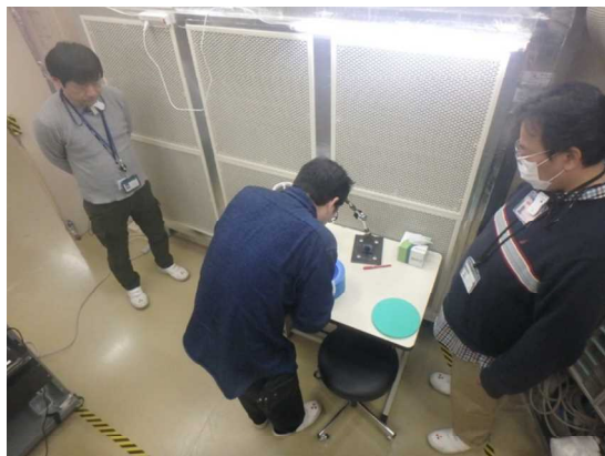
図 2 低温試料マウント

合計9個の凍結した単結晶試料について試料を凍結した状態で、回折計中心にマウントし、問題なく予備測定を行うことができた（図 2）。測定条件は以下のとおりである。加速器出力：