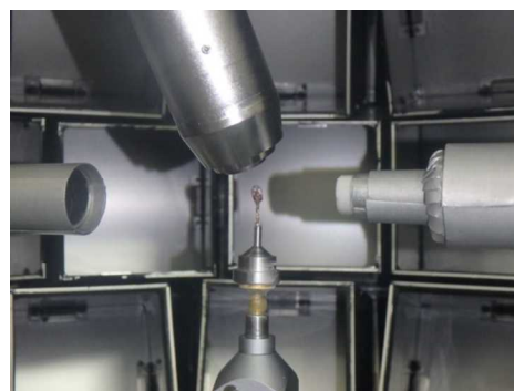
図1 低温測定時写真

タンパク質の単結晶試料を液体窒素によりクライオルーブにマウントした状態で凍結した。これらの結晶試料 9 個をまず予備測定として、30 分の露光時間で TOF 回折パターンの測定を行った。測定は冷却した窒素気流下(100K)で単結晶試料を低温に行なった(図1)。この予備測定の結果をもとに、最も結晶性が良く分解能が高いものを選定して、改めてこれを回折計にマウントして、次の日の朝まで長時間測定を実施した。