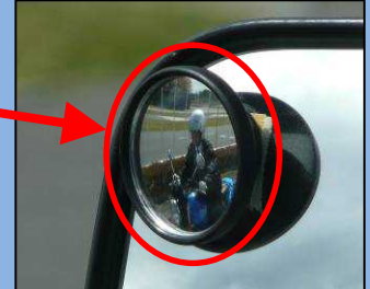
補助ミラーでは死角にいる 自動二輪車を確認できる。