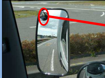
サイドミラーでは自動二輪車 を確認できない。