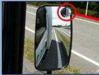
サイドミラーでは緊急車両 を確認できない。