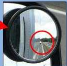
補助ミラーでは真後ろの 緊急車両を確認できる。