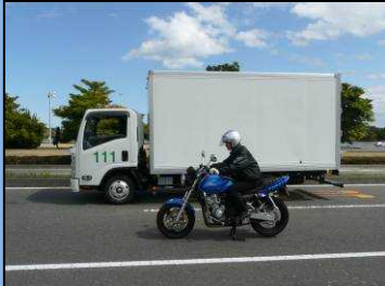
サイドミラーの死角にいる 自動二輪車