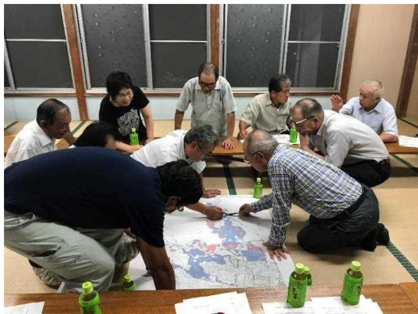
耕作者の現状把握 (だれが耕作しているの)