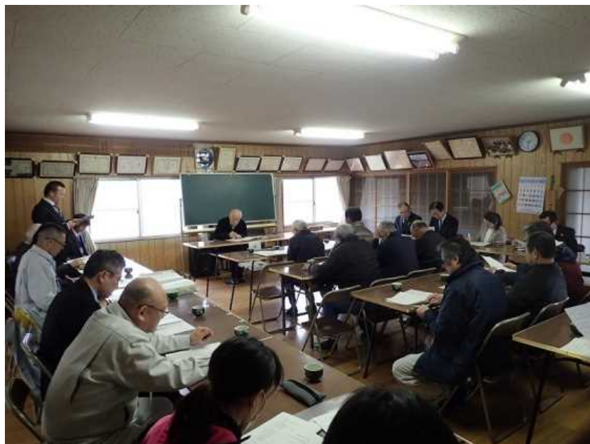
推進協議会を設立 (地元の体制づくり)