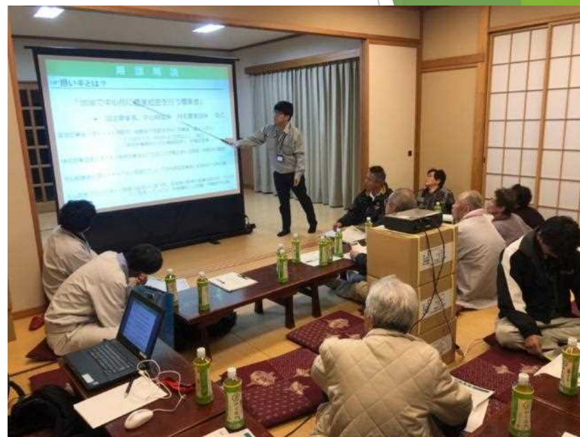
事業のしくみを説明 (担い手に農地を集めよう)