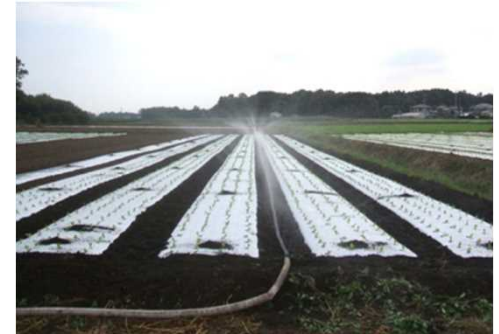
畑地かんがいの導入