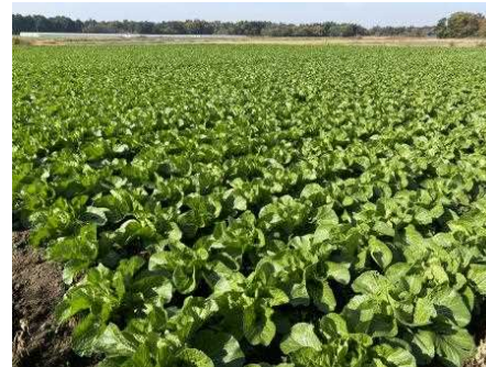
整備後の野菜作付状況