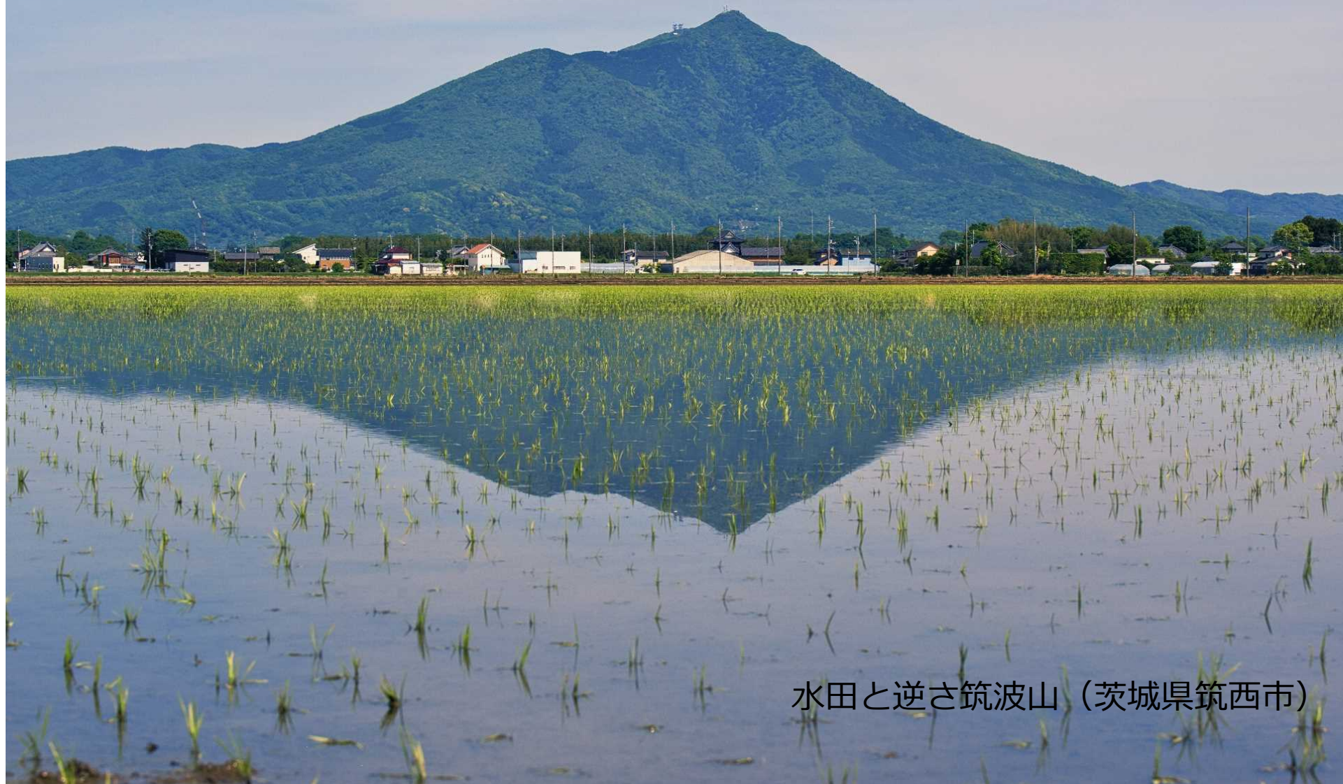
水田と逆さ筑波山（茨城県筑西市）