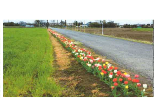
多面的機能の維持・発揮に向けた活動の支援