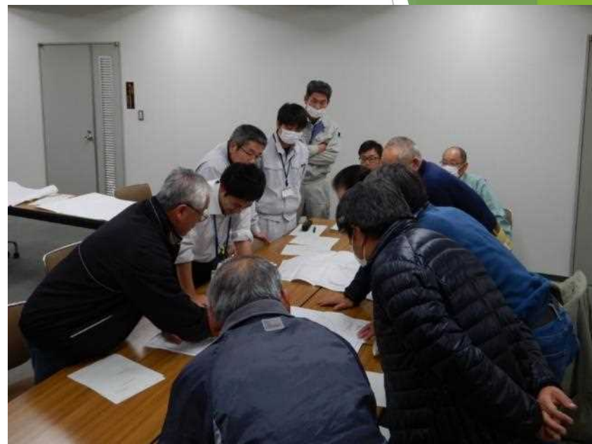
代表者と細かな打ち合わせ (地元要望や課題の整理)