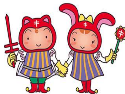
複十字シール運動キャラクター「シールぼうやとシールちゃん」