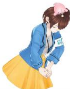
茨 ひより (茨城県公認 Vtuber)

※令和9年1月1日以降については、財務大臣が令和8年11月30日までに公示する延滞金特例基準額に応じて延滞金の割合が確定します。