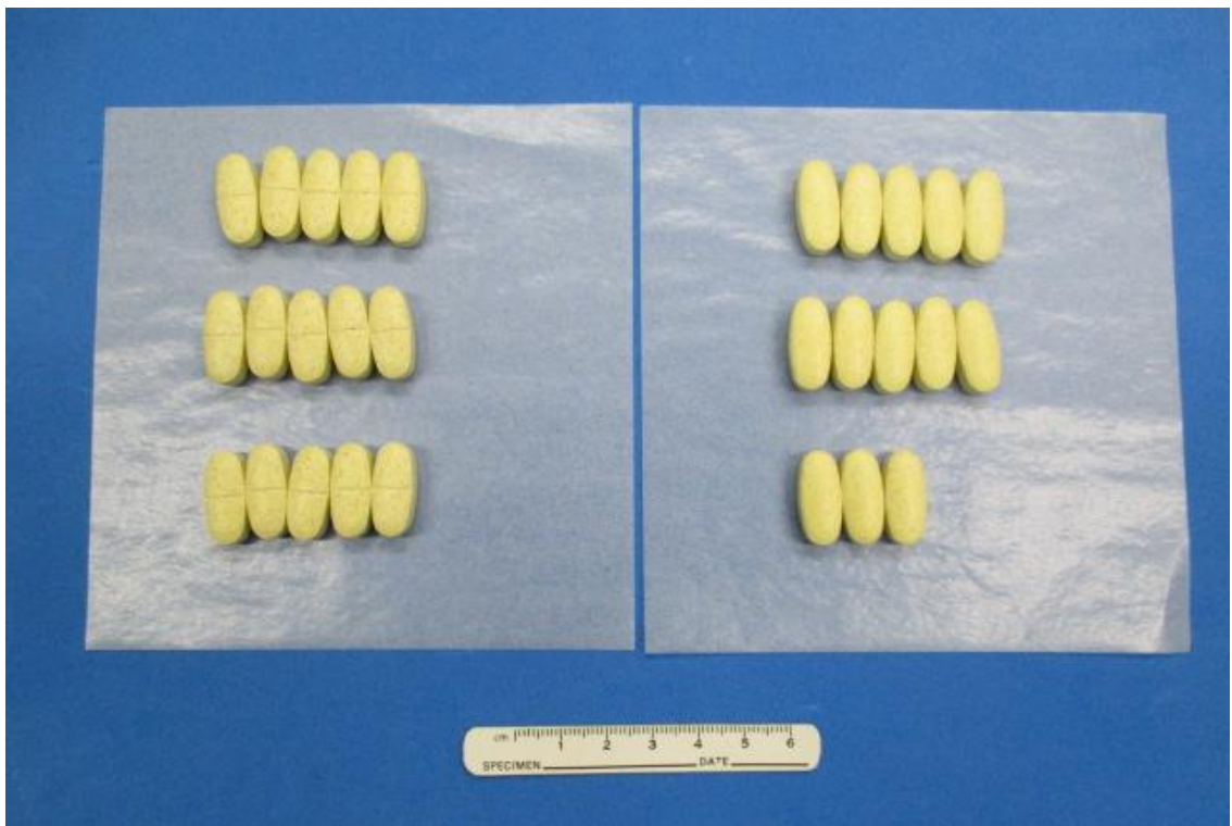
中に入っていた錠剤を薬包紙に並べた様子（28錠入り）