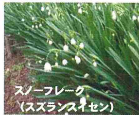
スノーフレック (スズランスイセン)