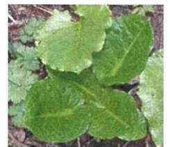
若い葉(左上1枚は別植物)