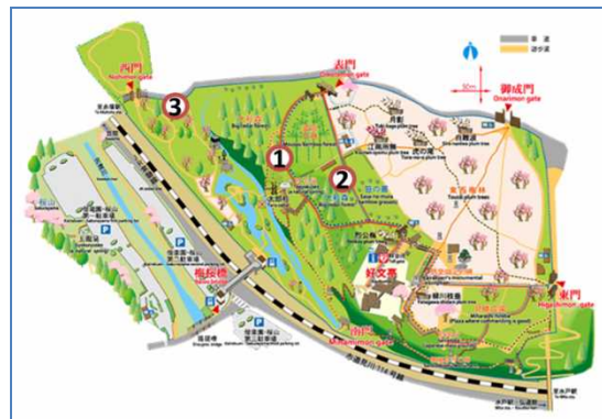
図 1 偕楽園内 3 調査定点

水戸市内にある偕楽園に, 図 1 に示した 3 カ所の調査定点を設定し, 2016 年 6 月第 2 週から 2016 年 10 月 3 週までの期間で月 2 回（計 10 回）蚊の調査を実施した。