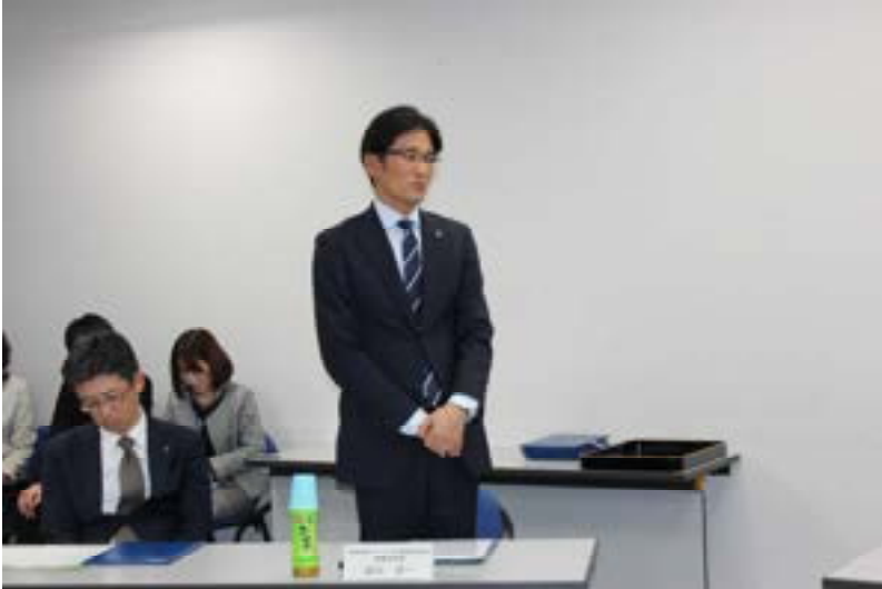
損保ジャパン日本興亜ひまわり生命保険株式会社 加世田関東統括部長