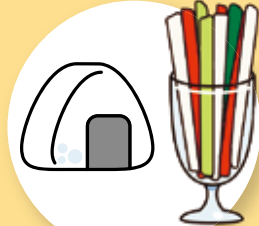
おにぎり小 1 個 (60 g...100 kcal) スティック野菜