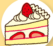
ショートケーキ 1 個 (約340 kcal)