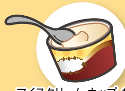
アイスクリーム カップ 1 個 (約360 kcal)