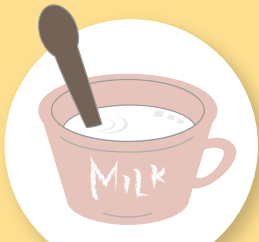
牛乳カップ 1/2 杯 (100 ml...70 kcal)