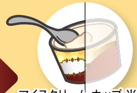
アイスクリーム カップ 半分 (約180 kcal)