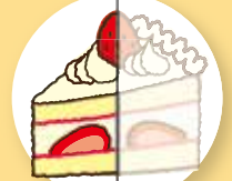
半分 (約170 kcal)