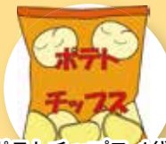
ポテトチップス 1 袋 (約550 kcal)