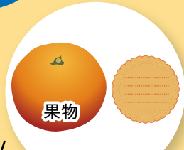
みかん大 1 個 (100 g...50 kcal) 幼児用ビスケット 1 枚 (10 g...50 kcal)