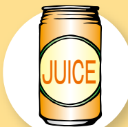
清涼飲料水 1 缶 350 ml (約150 ~ 170 kcal)