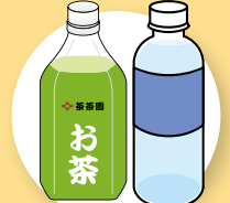
お茶・水 ほぼ0 kcal