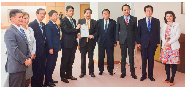
林外務大臣への要望