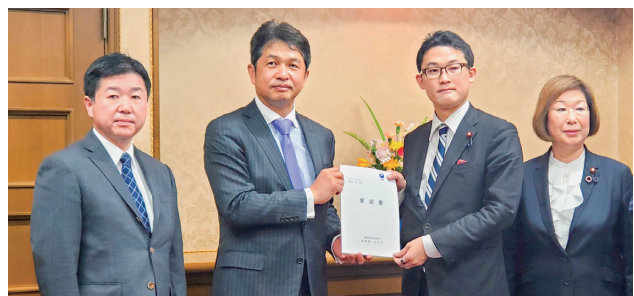
藤原財務大臣政務官への要望