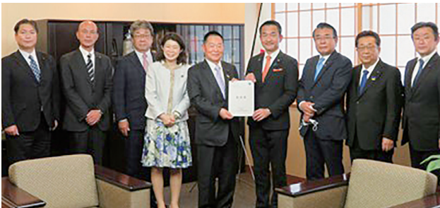
小田原外務副大臣への要望