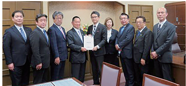
藤原財務大臣政務官への要望