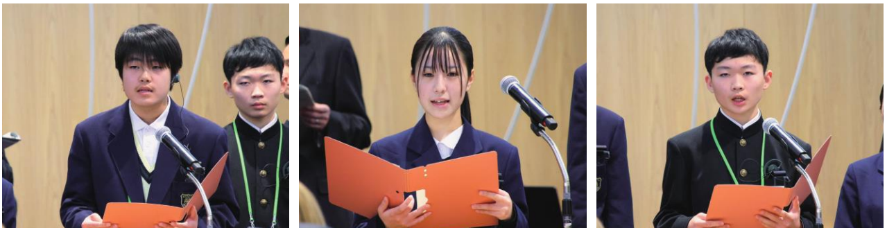
英語で「Mito16中学生安全サミット」の成果を発表