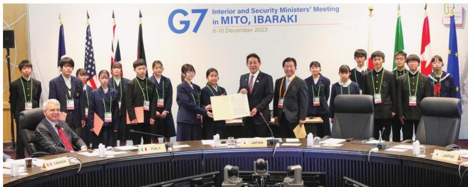
高橋市長と、地元中学生が松村国家公安委員会委員長に宣言書を手交