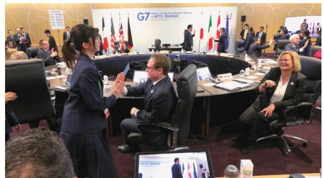
地元中学生はHODとハイタッチで退場