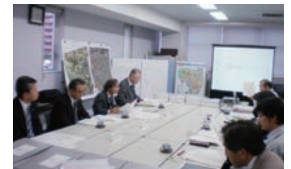
▲ 第36回評価員会 (平成24年11月13日)