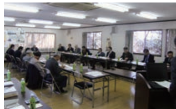
▲ 第40回審議会 (平成20年12月19日)