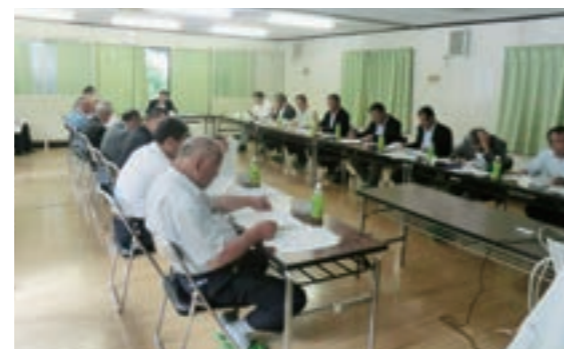
▲ 第50回審議会 (平成24年5月31日)