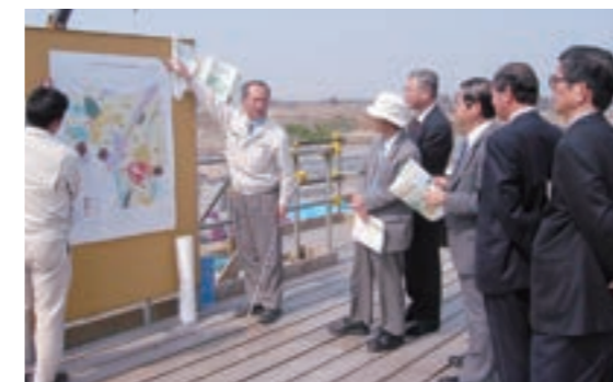
▲ 第20回評価員会 (平成15年3月24日)