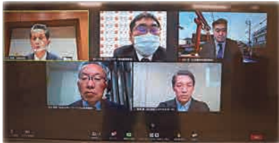
オンラインパネルディスカッション