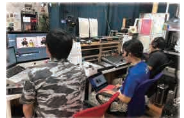
インターネット放送による情報配信