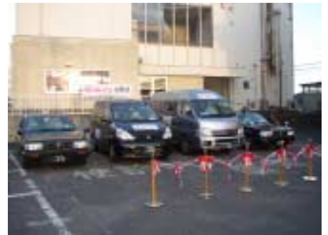
デマンドタクシー出発式

「あいのりくん」導入の背景には、平成 9 年 7 月から運行していた「福祉循環バス」の利用者数が、マイナス要素（利用者の固定化、循環路線運行による時間的制約等）により減少し、公共交通機関としての機能を果たしているとは言い難い状況にあったことが挙げられます。福祉循環バスに替わる公共交通のあり方を模索した結果、デマンド型交通システムを導入することとなりました。