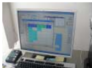
デマンドタクシー情報センターの様子