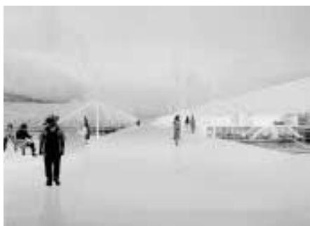
西口から橋上駅舎へ向かう自由通路内部空間（左）