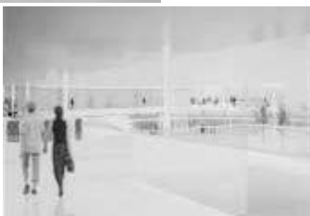
駅舎コンコースから東口交流支援施設を望む（右）

自由通路はまちへの風景を遮らないよう軽やかな構造体で構成することで、親しみやすいヒューマンスケールな空間となつて、誰からも永く愛される場所となります。また、東側に大きな開放空間を設けたコンコースは、海の存在感をより身近なものとし、いつまでもふるさとを感じさせる場所となります。