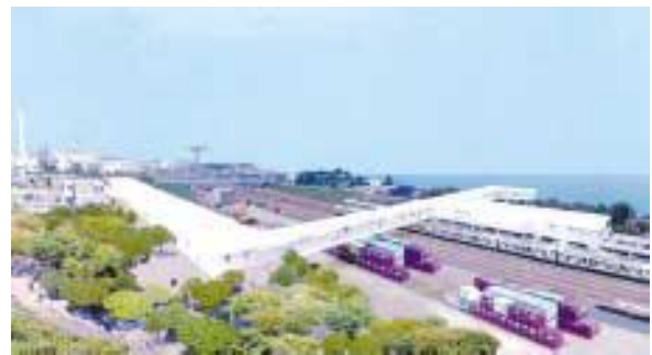
自由通路及び橋上駅舎の完成予想図

■東口交流支援施設：展望、情報発信、土産品販売、軽食・カフェ等各種機能を整備する。