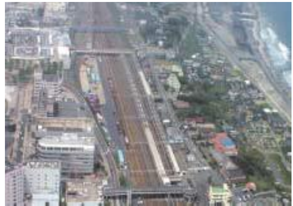
上空からみた現在の日立駅周辺地区、左上が日立駅中央口

面積約2,700㎡、ふれあい乗降場、タクシー・バス乗降場、トイレ、シェルターなどを設置