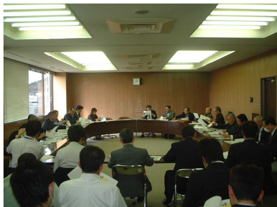
「みちづくりパートナーシップ」設立準備会

この取組みにあたり、活動の母体となる「(仮称)筑波山 美しいまち・みちづくりパートナーシップ代表者会議」を設立し、「日本風景街道」モデルルートへの申請を行いました。これまでに準備会を開催し、4月23日(日)、設立する予定です。