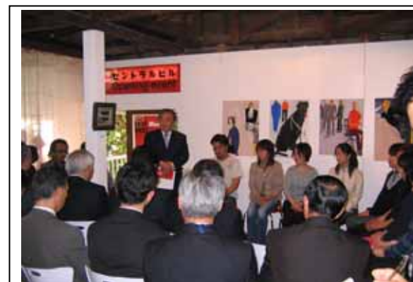
【オープニングレセプション】