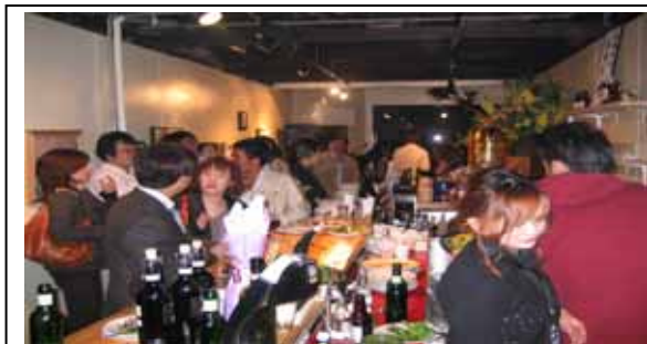
【バンドによる演奏会】

このようなプロジェクトは、志の高いチームとボランティアがいれば、どこでも可能である。県内の多くの市民団体が、このような事業に挑戦して欲しい。