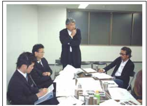
【店舗経営支援チーム会議】

店舗経営のプロたちとチームをつくり、チャレンジショップ運営事業とリノベーション手法の相乗効果による水戸の街なか再生をめざし、それによって元気な商売人を育て、かつ美しい街なみ形成を実現しようと考えた。