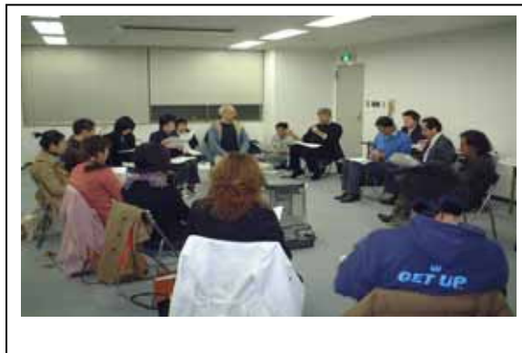
【出店予定者とのミーティング】

お店づくりと平行して、2月から4月上旬まで、出店予定者ミーティングを合計8回開催した。その中で、経営上の課題や営業時間、定休日などについて話し合いがもたれた。