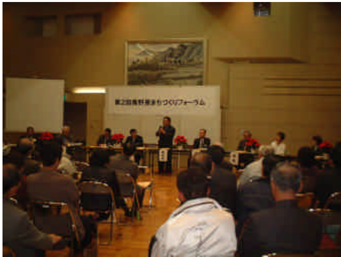
< 第2回美野里まちづくりフォーラムの様子 >

「美野里町都市計画マスタープラン」を住民主体で策定していくために組織された「美野里町まちづくり会議」の活動の集大成とも言える「第2回美野里まちづくりフォーラム」が、11月30日に町民など70名が参加して開催されました。