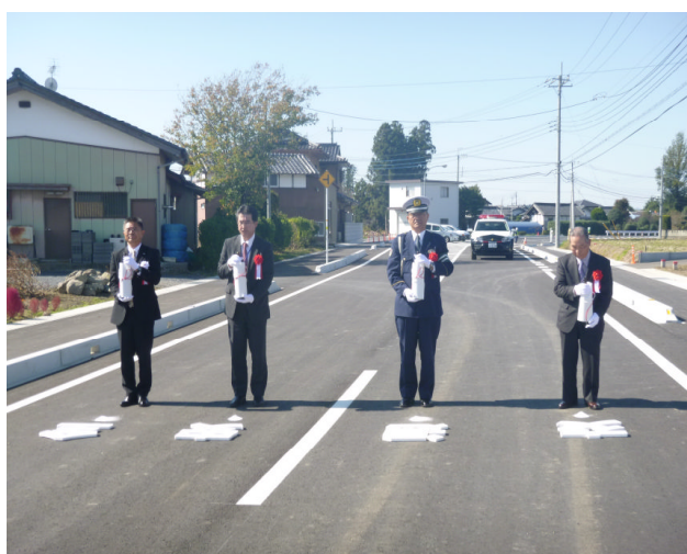
交通安全祈願式典の様子