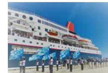
クルーズ船をお出迎え