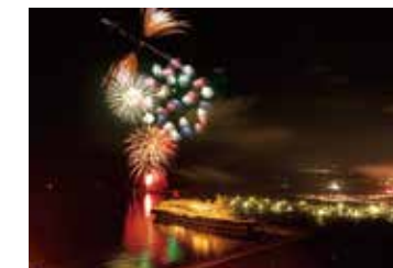
花火を臨むクルーズ船