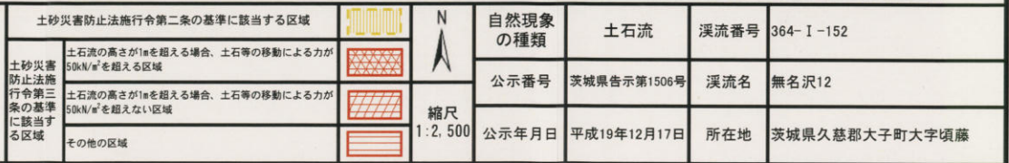
様式-3 (土) 土砂災害警戒区域・土砂災害特別警戒区域 区分図 (その3)