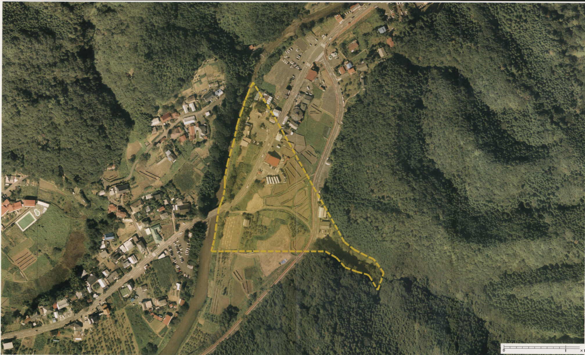
様式-3 (土) 土砂災害警戒区域・土砂災害特別警戒区域 区分図 (その3)