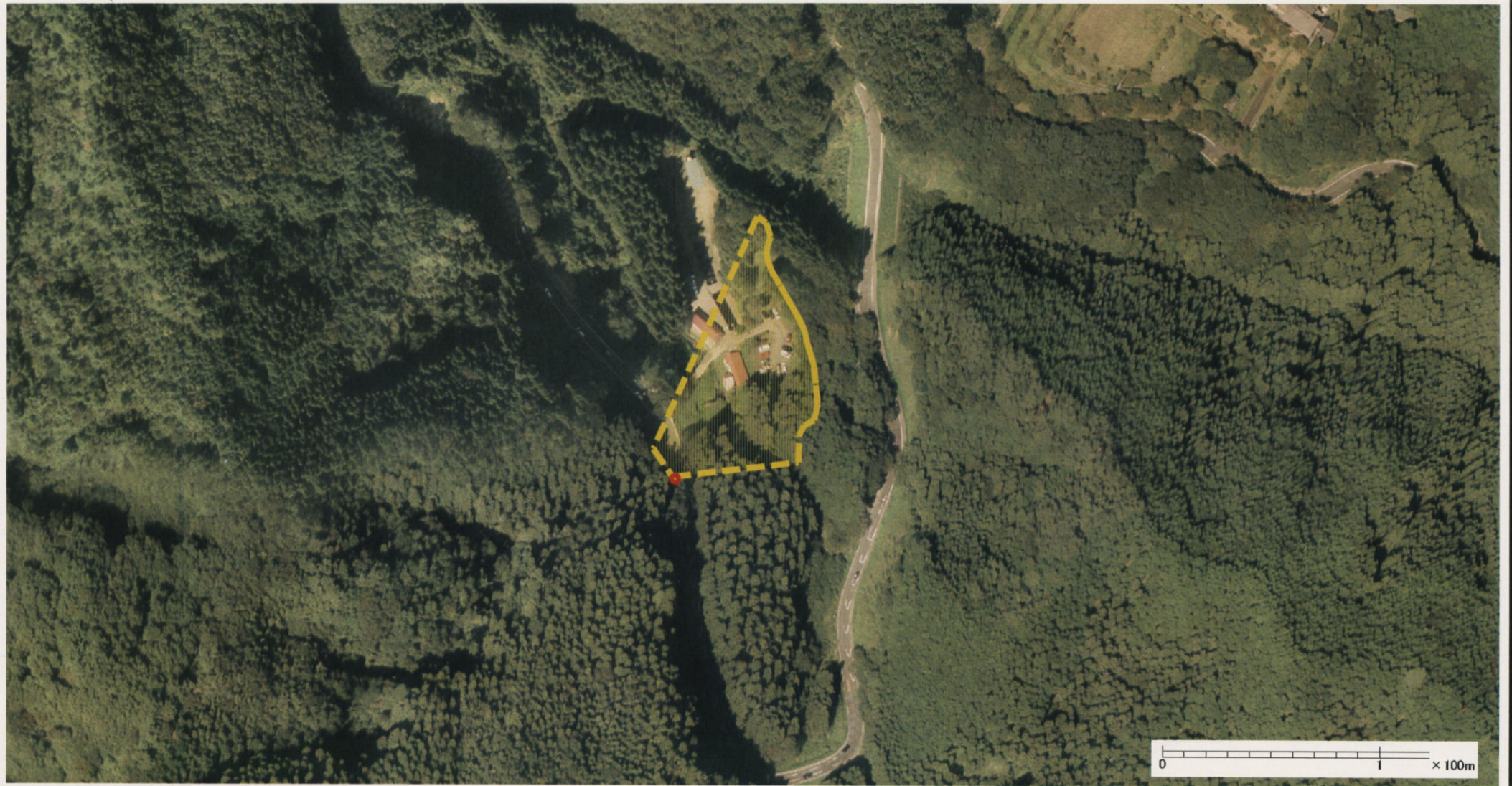
様式-3 (土) 土砂災害警戒区域・土砂災害特別警戒区域 区分図 (その2)