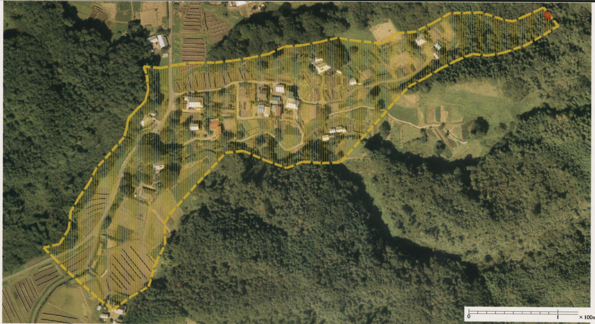
様式-3 (土) 土砂災害警戒区域・土砂災害特別警戒区域 区分図 (その2)