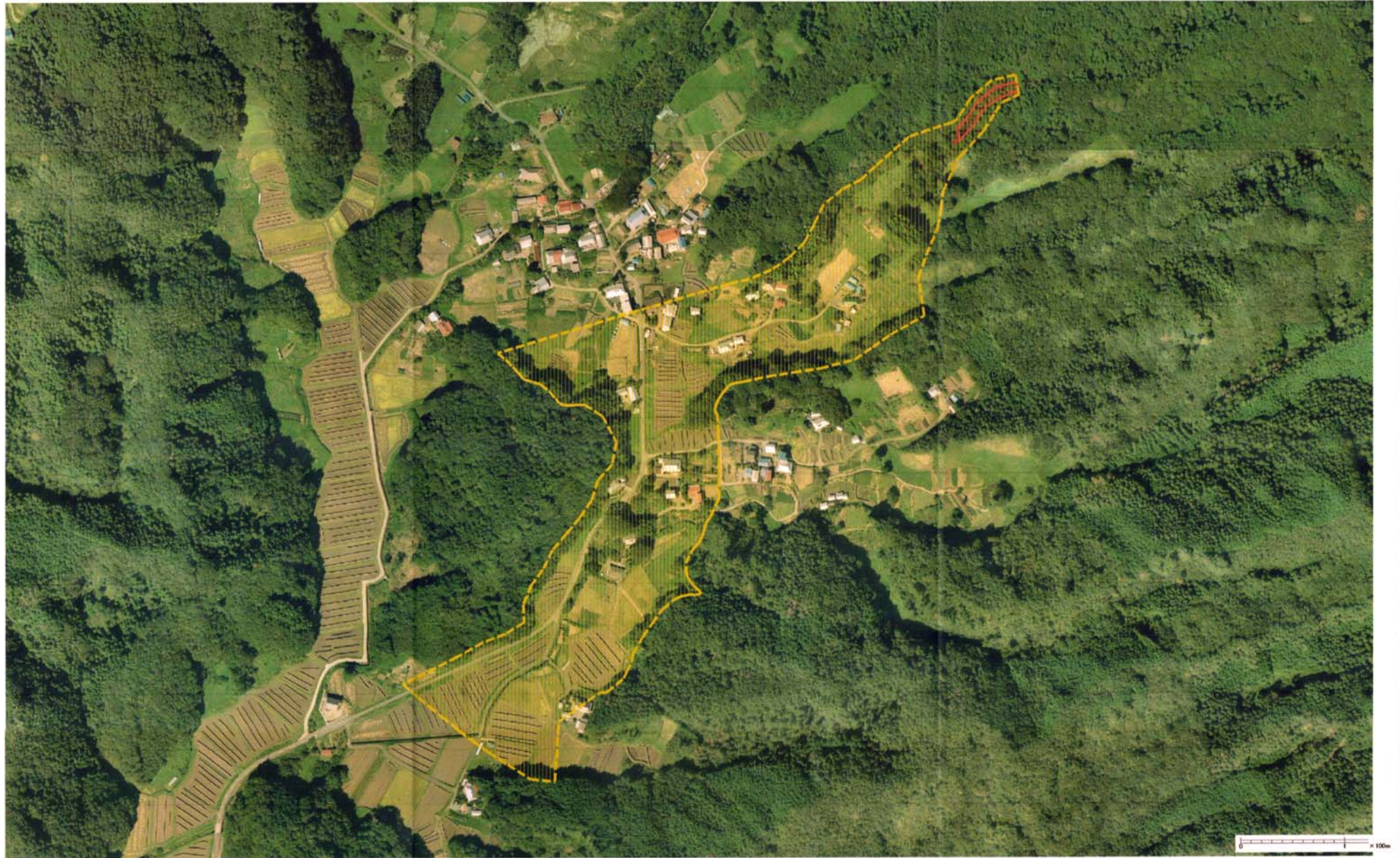
様式-3 (土) 土砂災害警戒区域・土砂災害特別警戒区域 区分図 (その2)