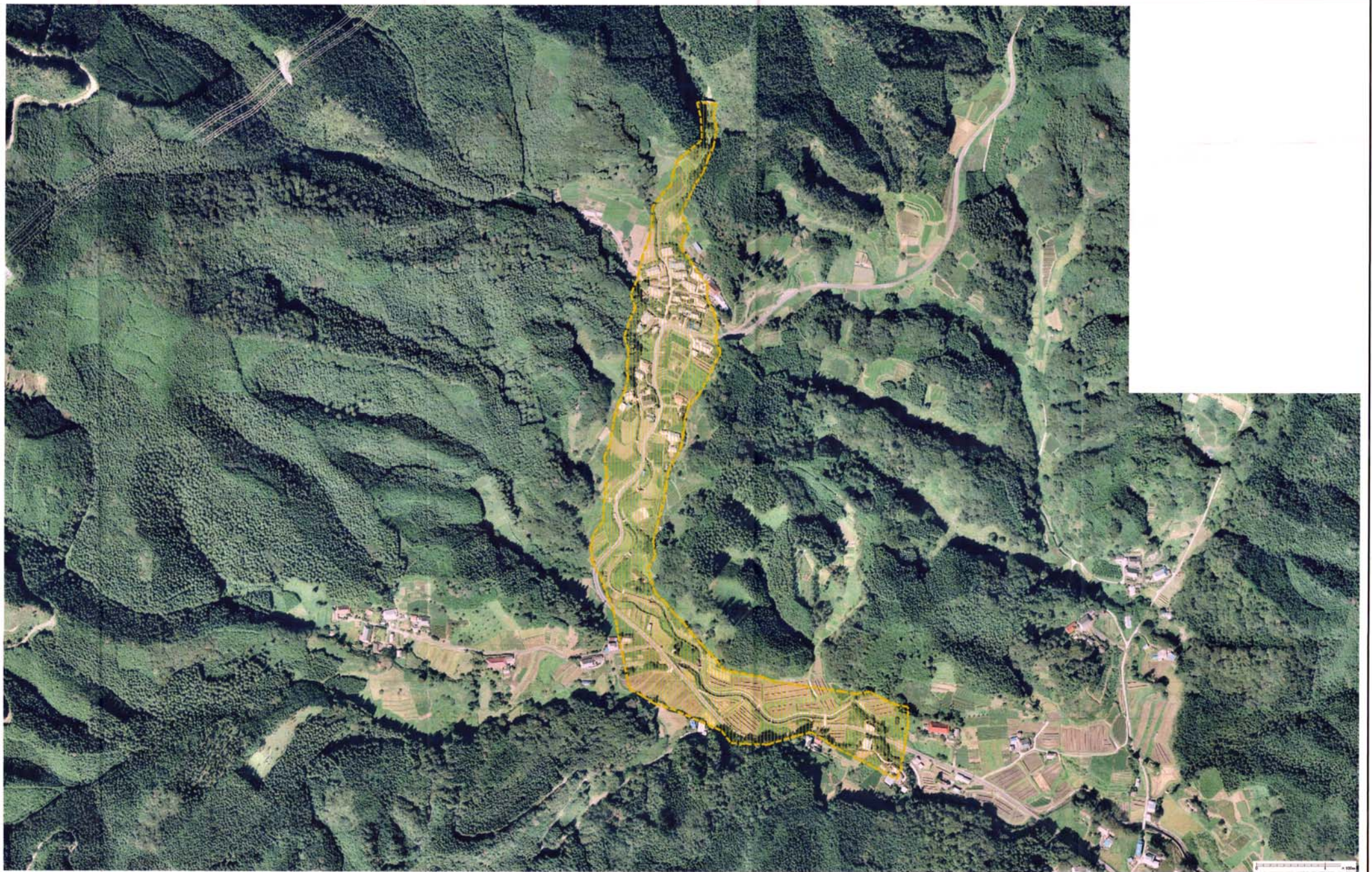
様式-3 (土) 土砂災害警戒区域・土砂災害特別警戒区域 区分図 (その3)