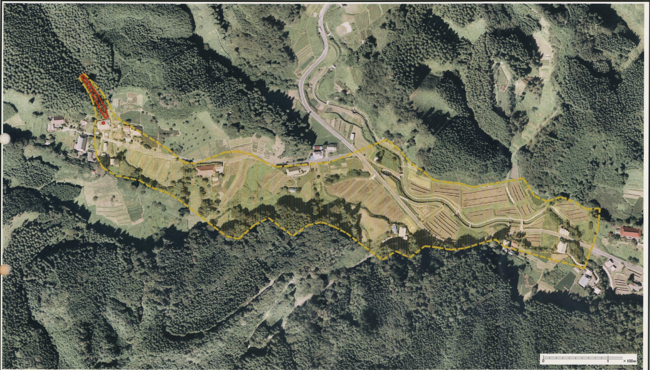
様式-3(土) 土砂災害警戒区域・土砂災害特別警戒区域 区分図(その3)