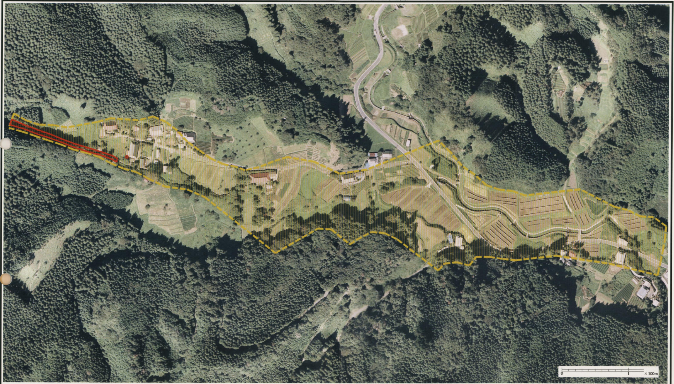
様式-3 (土) 土砂災害警戒区域・土砂災害特別警戒区域 区分図 (その3)