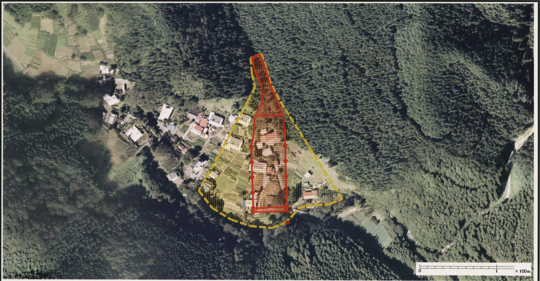
様式-3 (土) 土砂災害警戒区域・土砂災害特別警戒区域 区分図 (その2)