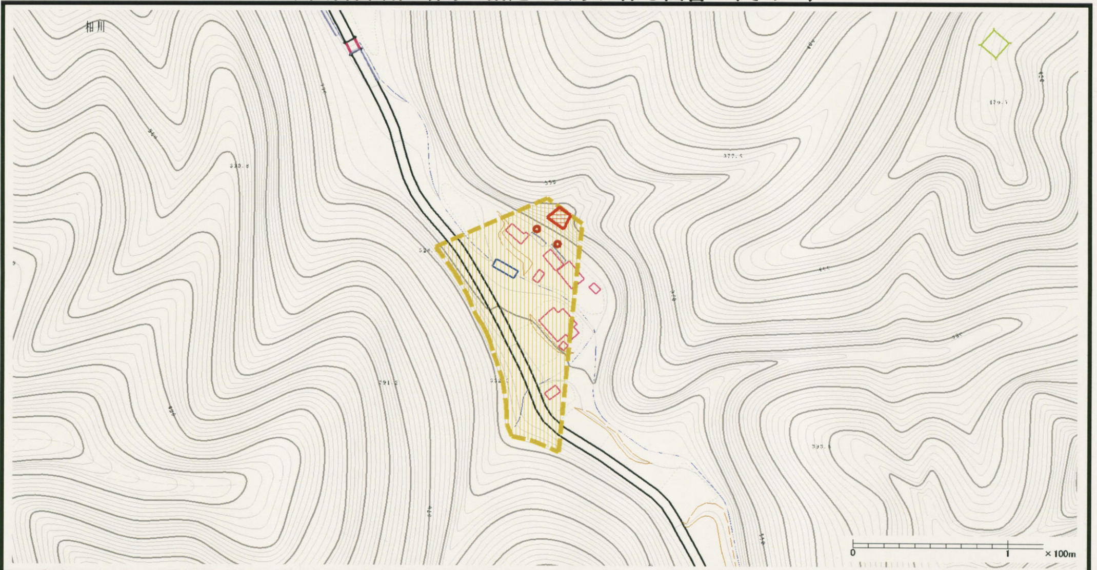
様式-2 (土) 土砂災害警戒区域・土砂災害特別警戒区域 区分図 (その1)