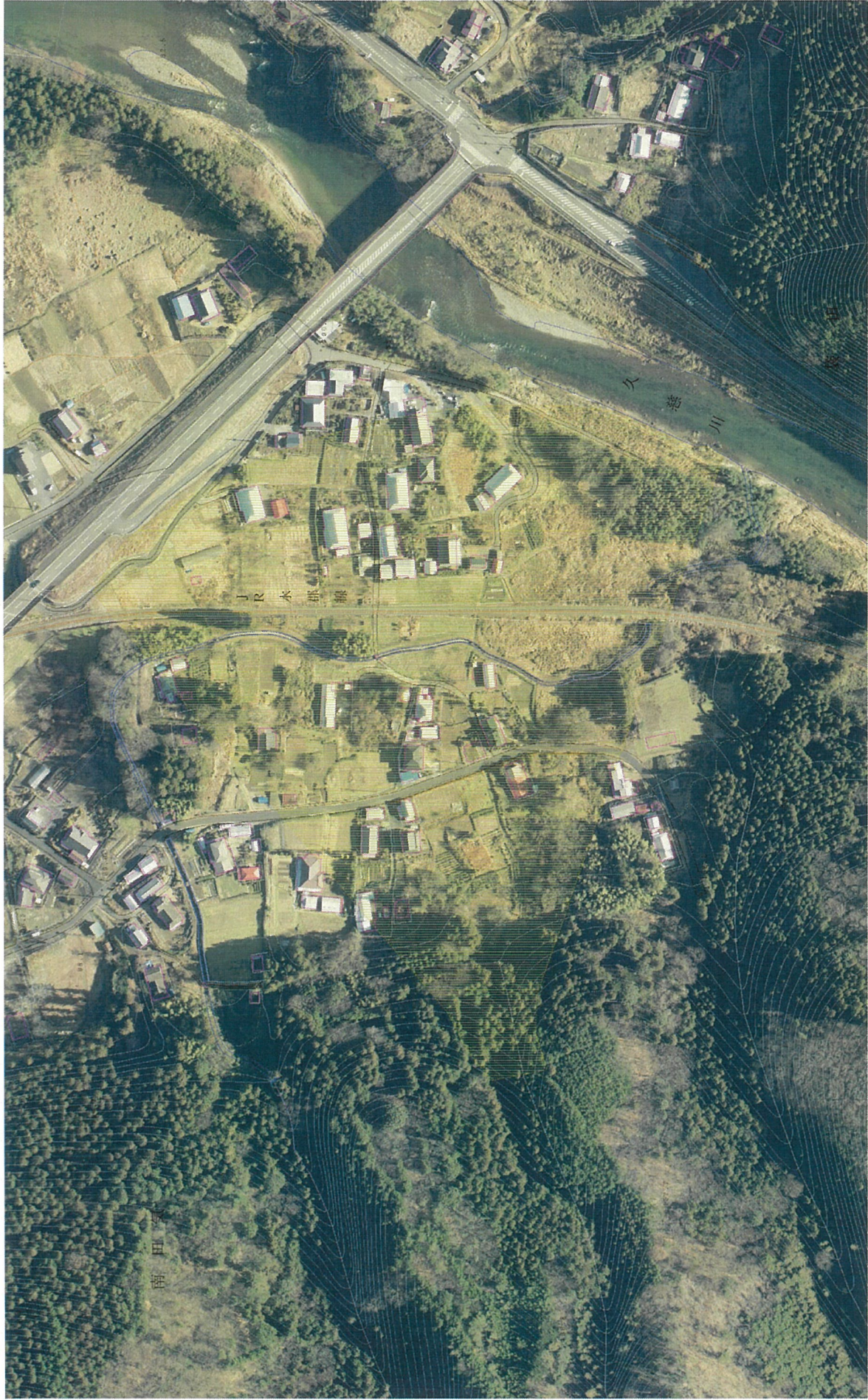
土砂災害警戒区域等の指定の公示に係る図画(その3)