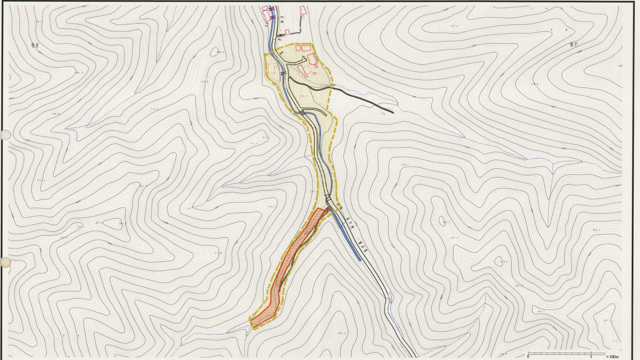
様式-2(土) 土砂災害警戒区域・土砂災害特別警戒区域 区分図(その1)