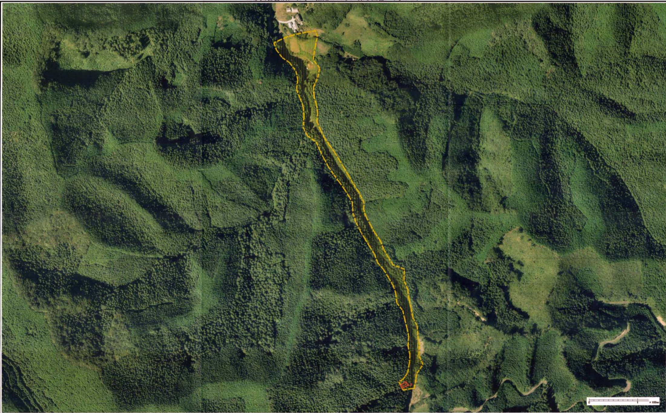
様式-3 (土) 土砂災害警戒区域・土砂災害特別警戒区域 区分図 (その3)