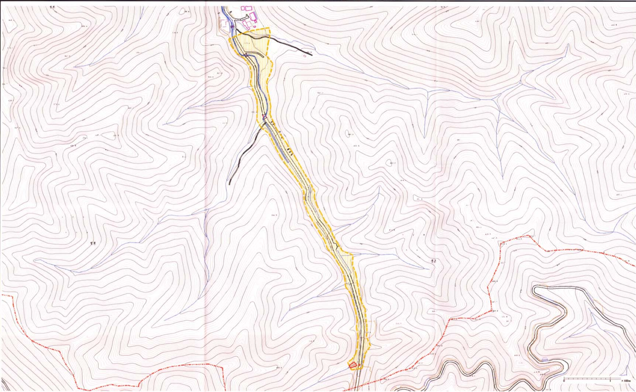
様式-2 (土) 土砂災害警戒区域・土砂災害特別警戒区域 区分図 (その2)