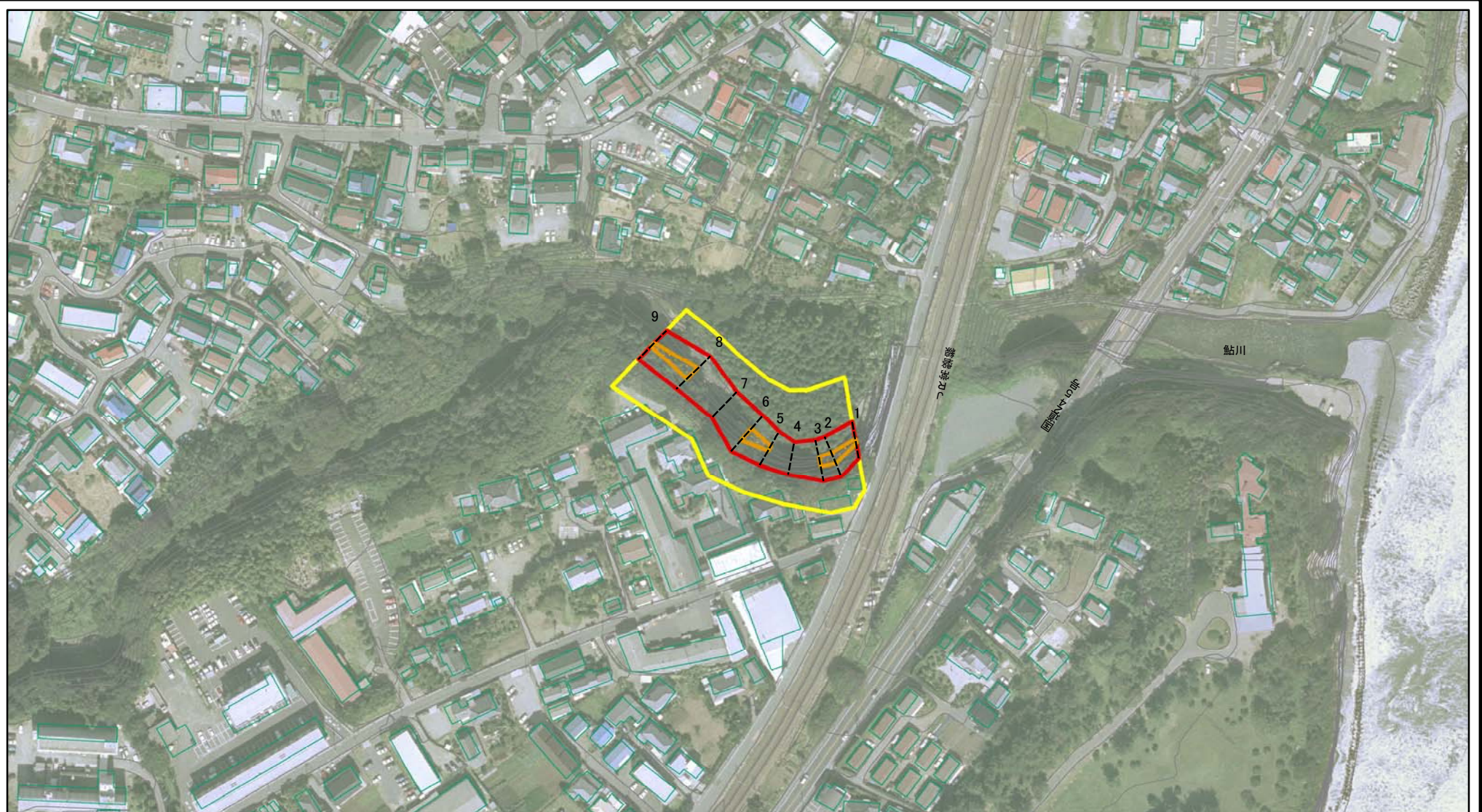
図中の数字は横断測線番号を示す