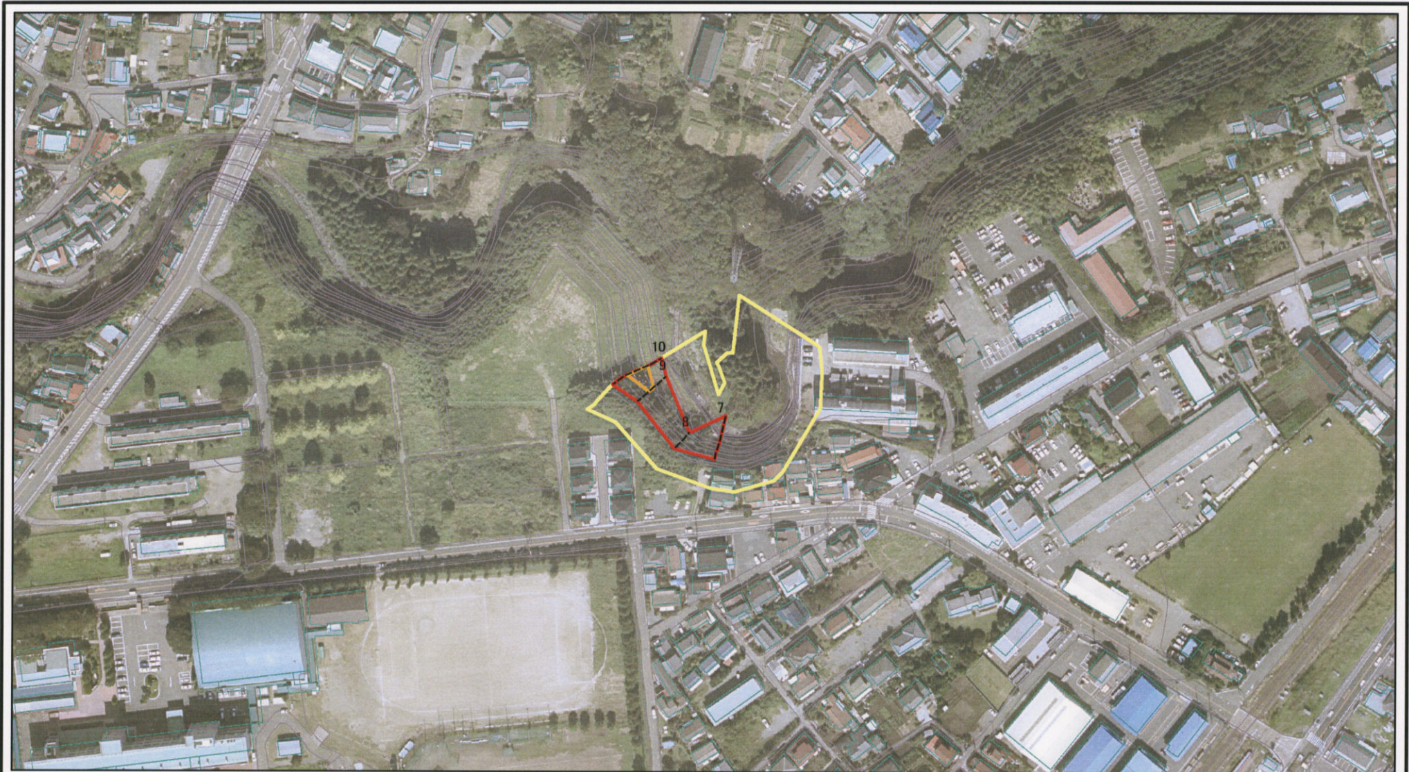
図中の数字は横断測線番号を示す