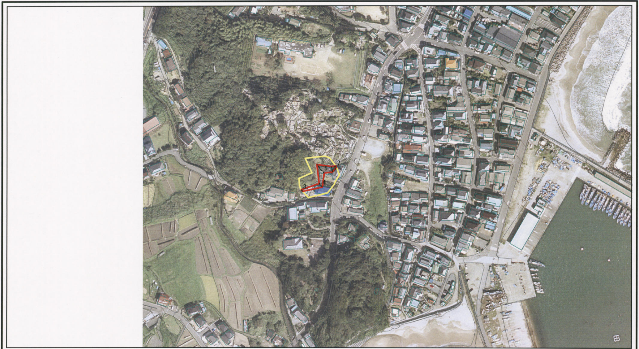
図中の数字は横断測線番号を示す