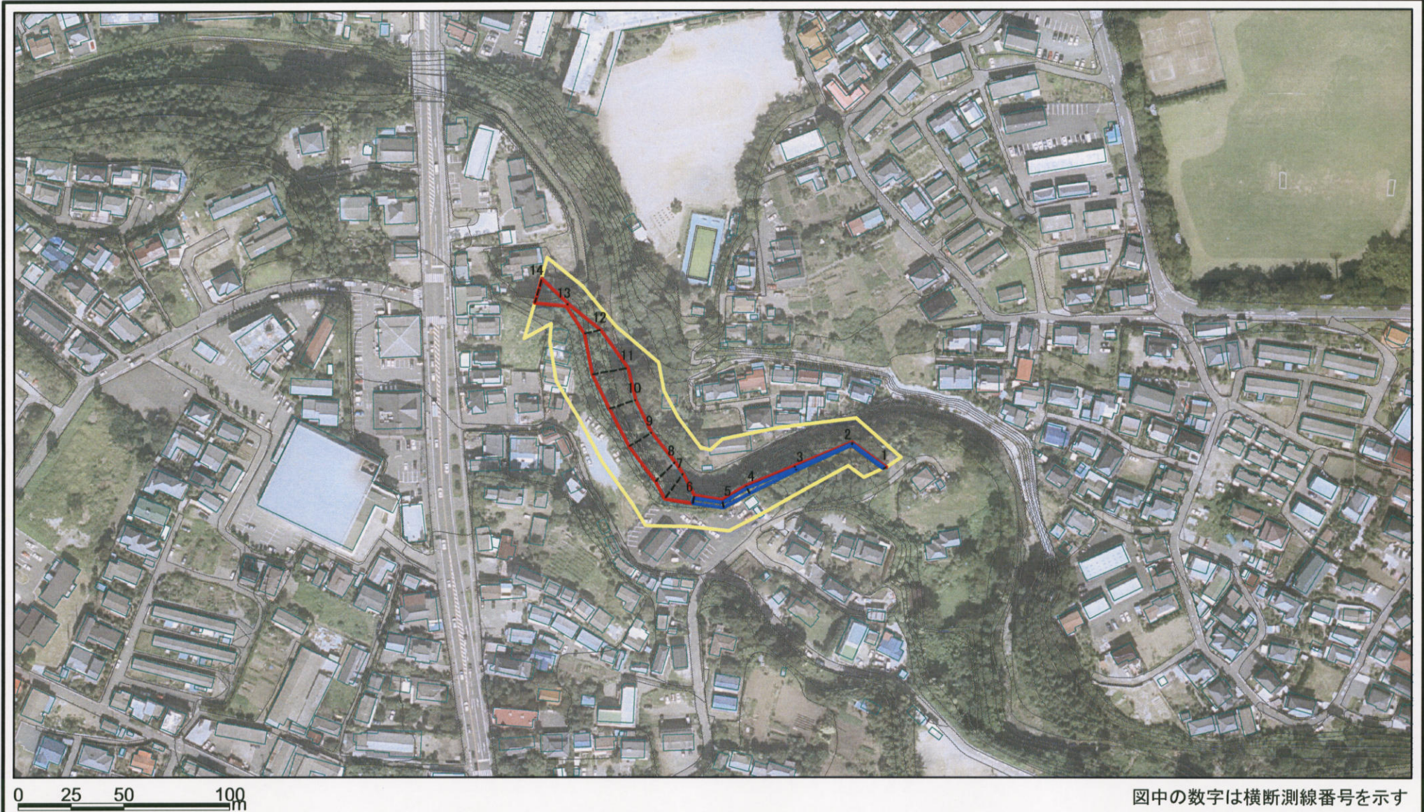
図中の数字は横断測線番号を示す