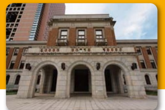
群馬県庁 昭和庁舎

魅力いっぱいの群馬県へ、ぜひお越しいただき、群馬県のおもてなし料理であるすき焼き、おつきりこみや焼きまんじゅうなどの「地元グルメ」も堪能してください!