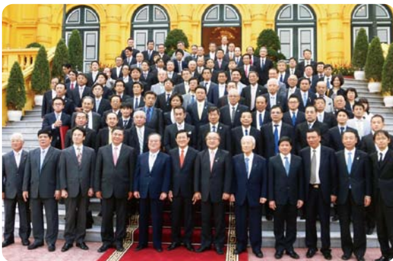
ベトナム国家主席府前での記念撮影(2014年10月)