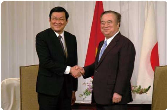
チュオン・タン・サン国家主席来県(2014年3月)