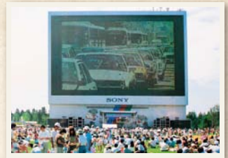
20インチテレビ1万台分の大きさのジャンボトロン