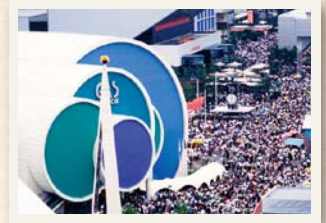
1日の入場者数、会期中最高の33万人を記録（9月15日）