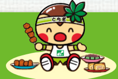
栃木県のマスコット「とちまるくん」