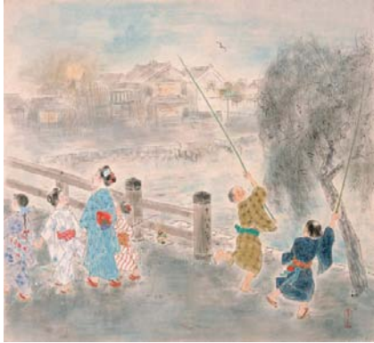
鍋木清方「夕路のゆきかい」昭和34(1959)年

一年で最も暑く、生命感みなぎる夏の季節。太陽の光がさんさんと降り注ぎ、植物は緑鮮やかに生い茂り、その盛りを迎えます。こうした豊かな自然と共に、鶺鴒いや夕涼み、花火などを楽しむ人々のくらしは、夏の風物詩として絵画作品にもしばしば取り上げられ、詩情豊かに表現されています。