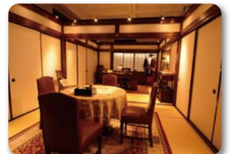
大河ドラマ館内部