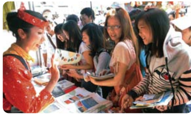
ベトナム人で賑わうジャパンフェスの 茨城県ブース(2014年11月)