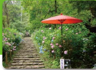
太平山神社表参道のあじさい坂。約2,500株のアジサイが咲き誇る。(見頃は6月下旬～7月上旬頃)