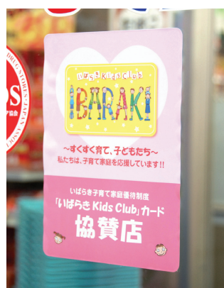
このステッカーが目印です

那珂市のドラッグストアでは、「いばらき Kids Club」の協賛店として、粗品のサービスを行っています。店長さんは、「二千元以上の買い物をし、カードを提示するとティッシュを一箱プレゼントしています。子育て家庭に喜んでもらえ、地域に貢献できる制度ですから、継続していきたいです」と話していました。子ども連れのお母さんは、「と