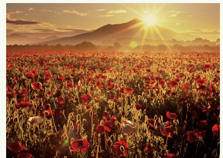
▲小貝川ふれあい公園(5月中旬)

このコーナーでは、いばらきが誇る「頑張る人」「もの」「場所(風景)」などを紹介していきます。