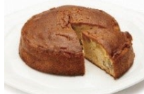
◀スイーツ王子・西園誠一郎シェフが手掛けた限定スイーツ「ひな菊とキャラメル」のケーキ