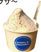
▲えごまジェラート

近隣で栽培したえごまを使った「えごま油」がおすすめ。また、遊具を備えた公園で遊ぶことができ、バーベキュー設備も完備!