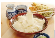
◀つるんとした食感の「ひもかわうどん」

また桐生市では、織物の仕事で忙しいため、簡単に調理できるうどんが好まれました。市内に100軒以上あるうどん店では、幅が広い「ひもかわうどん」が人気です。