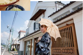
▲本町2丁目にある玉上薬局