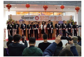
就航を記念して、関係者でテープカット！

茨城空港からチャーター便で行く！魅力いっぱいの台湾へ!! お得なツアー情報はこちらから→