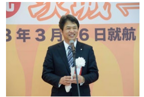
台湾から茨城へ、ようこそいらっしゃいました！