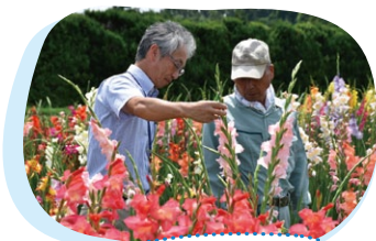
品目別栽培技術高度化講座

本県の農業をけん引する「経営感覚に優れた農業者」を育成するため、県では、平成29年度から、大学や研究機関、民間企業など、産学官の連携によって体系的な学びの場を提供する「いばらき農業アカデミー」を開設しています。