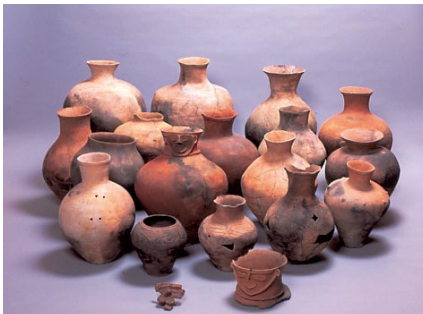
おのてんじんまえいせき 「弥生土器 小野天神前遺跡出土」(当館蔵)

本展では、県内で出土した考古資料を中心に、縄文土器から陶磁器まで時代ごとの「やきもの」の特徴に触れ、その歴史について紹介します。