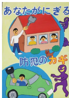
平成28年防犯ポスターコンクール入選作品