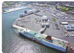
大洗港区に着岸中のフェリー

このたび、4隻のうち2隻のフェリーが更新時期を迎えたため、5月と8月に新造船が就航します。