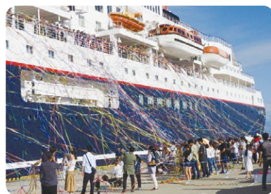
にっぽん丸のお見送り